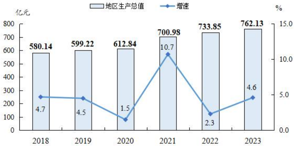
图 1 2018-2023年地区生产总值及其增长速度

全年地方一般公共预算收入 46.27 亿元，同比增长 14.0%。其中，税收收入 15.58 亿元，增长 18.6%；非税收入 30.69 亿元，增长 11.8%。全县国内税收收入 42.57 亿元，增长 26.2%。地方一般公共预算支出 87.23 亿元，下降 3.2%。其中，教育支出 22.25 亿元，增长 1.6%；社会保障和就业支出 14.71 亿元，增长 11.3%；卫生健康支出 8.87 亿元，下降 20.3%；农林水事务支出 10.02 亿元，增长 0.3%。