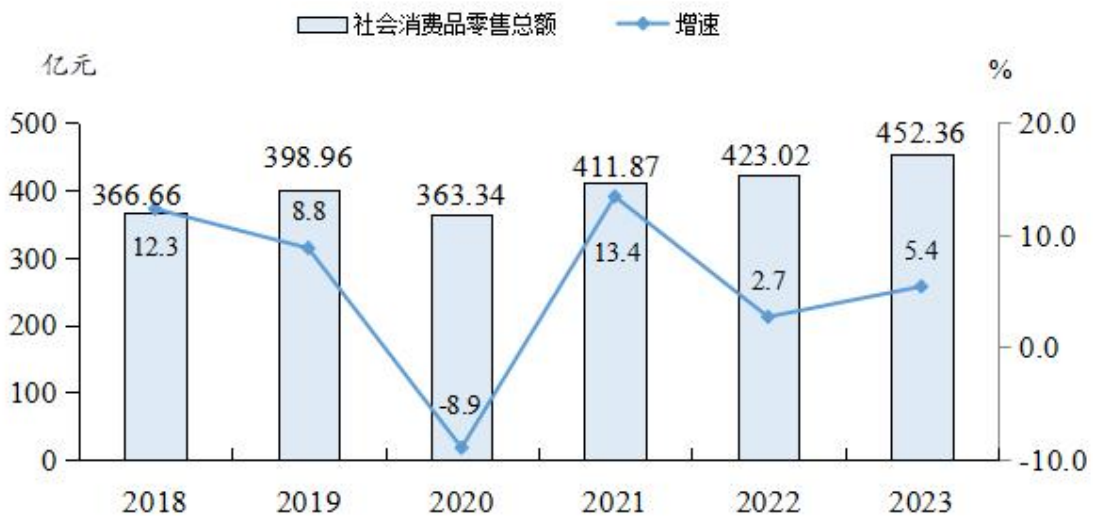
图 3 2018-2023年社会消费品零售总额及增长速度

全县限额以上商贸业单位共 385 家，其中批发业 122 家、零售业 136 家、住宿业 73 家、餐饮业 54 家。